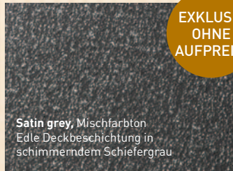
Satin grey , Mischfarbton Edle Deckbeschichtung in schimmerndem Schiefergrau