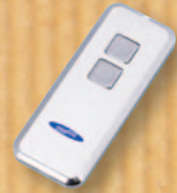
Handsender „Mini-Novotron 522 Design“